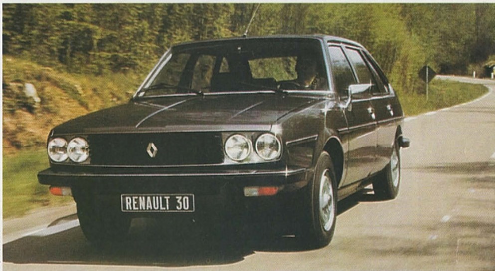
Bien entendu, la nouvelle Renault 30 demeure une traction avant afin de conserver une tenue de route adéquate.

Depuis la carrière en demi-teinte de la Frégate dans les années cinquante, le marché du haut de gamme est totalement délaissé par la Régie. La naissance de la Renault 30 au milieu de la décennie soixante-dix relance la marque sur ce créneau difficile.